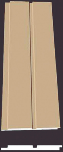
SD 110 50 x 4 x 200 cm