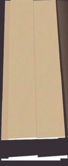
SD 140 50 x 4 x 200 cm