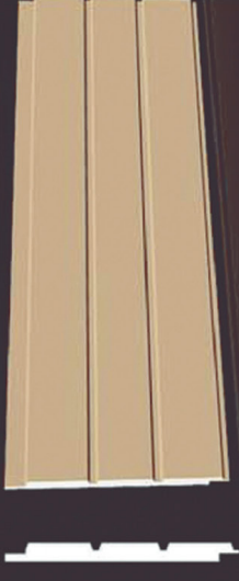
SD 160 50 x 4 x 200 cm