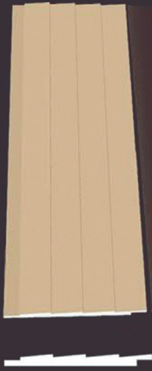
SD 130 50 x 4 x 200 cm