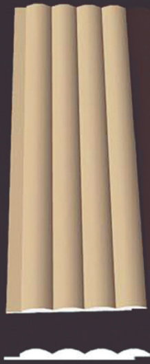
SD 150 50 x 4 x 200 cm