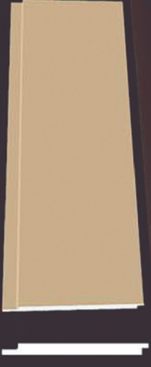
SD 120 50 x 4 x 200 cm